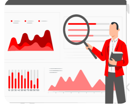
Tablo 2. Projelerin Sektöre Göre Harcama Detayları

Üniversitemiz 2020 yılı yatırım bütçesinin başlangıç ödenekleri toplamı 11.000.000,00 TL olup yıl içerisinde eklenen ve tenkis edilen ödeneklerle birlikte yılsonu ödenek toplamı 14.000.000,00 TL olmuştur. Projelerin sektöre göre harcama detayları aşağıdaki çizelgede yer almaktadır: