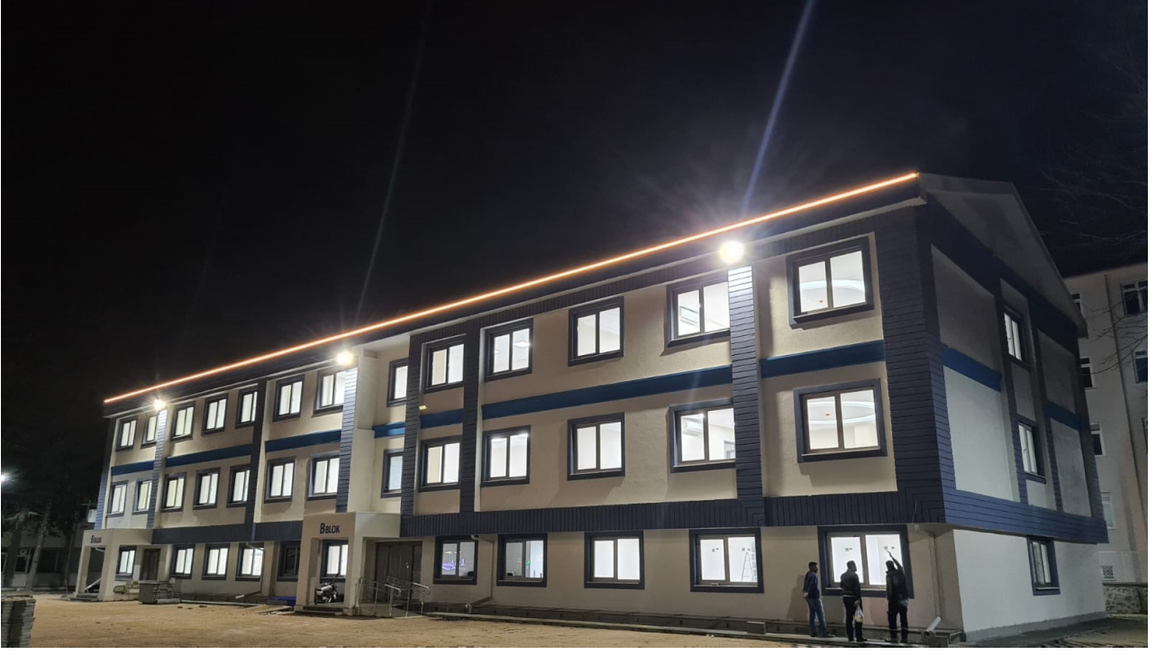
Eğirdir MYO Uygulama Mutfağı Tadilatı