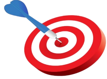
Tablo.1 Amaç ve Hedefler

Üniversitemiz kendi stratejik planını oluşturuncaya kadar Süleyman Demirel Üniversitesinin stratejik amaç ve hedefleri üzerinden devam etmiş olup kendi stratejik planımız için belirlediğimiz “Uygulamalı Eğitim” konseptiyle uyumlu stratejik amaç ve hedeflerimiz aşağıda yer almaktadır.